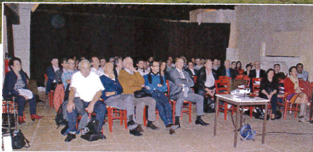
L'après-midi a été consacré aux travaux de l'AIPF.

Matfer Bourgeat est un groupe industriel français, leader mondial pour les petits équipements de cuisines et laboratoires professionnels de pâtisserie. Ses matériels, reconnus et appréciés depuis 200 ans, contribuent à la création et à la préservation du goût. C'est dans cette optique que Matfer Bourgeat lance, chaque année, près d'un millier de nouveaux produits.