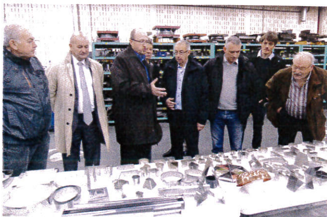
Cette visite passionnante du site a montré le dynamisme de Matfer dans sa quête d'innovation au service des métiers de bouche.